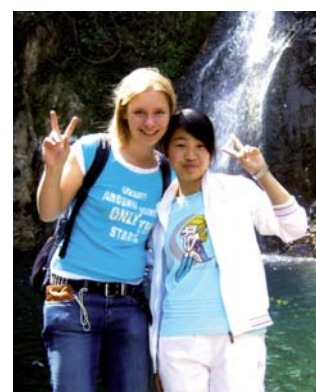
Ausflüge in die Umgebung Ningbos sind Teil des Programms der Schülerinnen und Schüler.