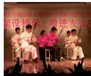
Empfang in Jiangyin mit traditioneller chinesischer Musik unter dem Austauschmotto: „Build a bridge & promote the friendship“.