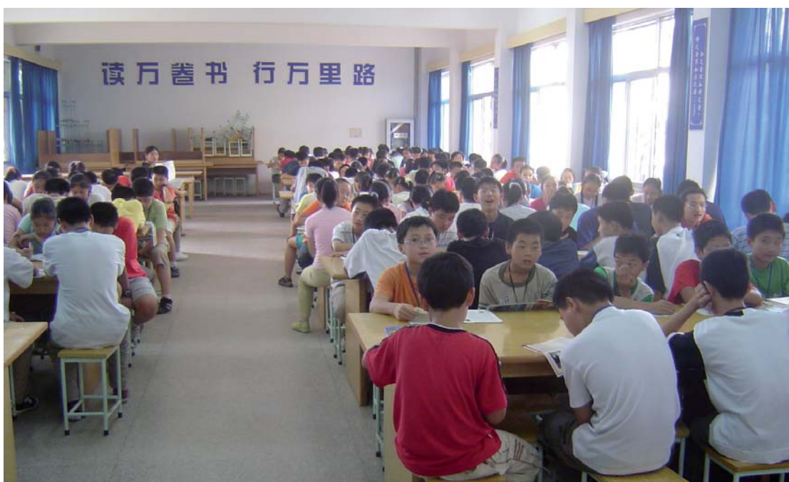
Lesestunde chinesischer Schüler in der Bibliothek.