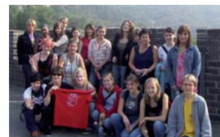
„Einmal auf der Chinesischen Mauer“ – für Oberstufenschüler der GSG ist das ein Highlight ihrer Chinareise.