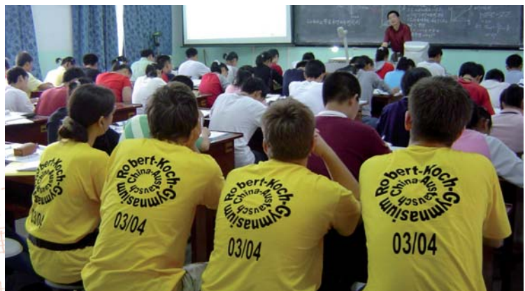
Dem chinesischen Physikunterricht können auch deutsche Schüler bestens folgen.